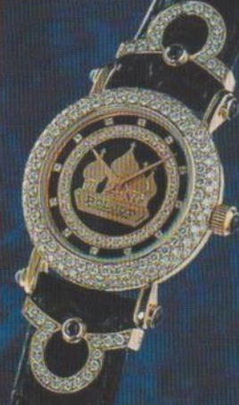
850 éves Moszkva